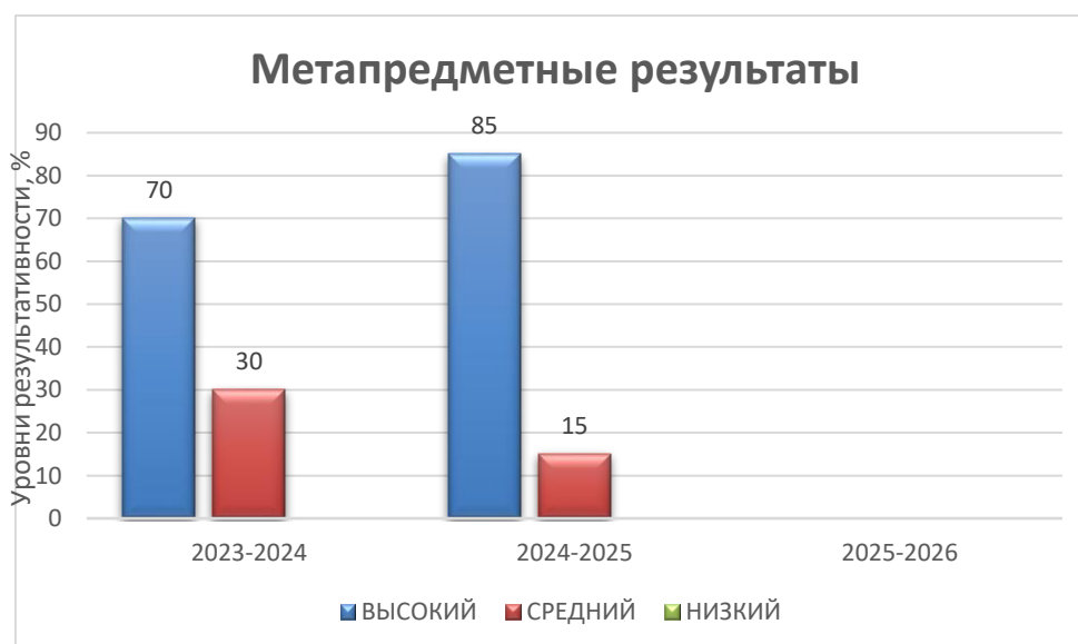
Рисунок 2. Оценка уровня сформированности метапредметных результатов по программе «Занимательная экологии. Экологическое краеведение»