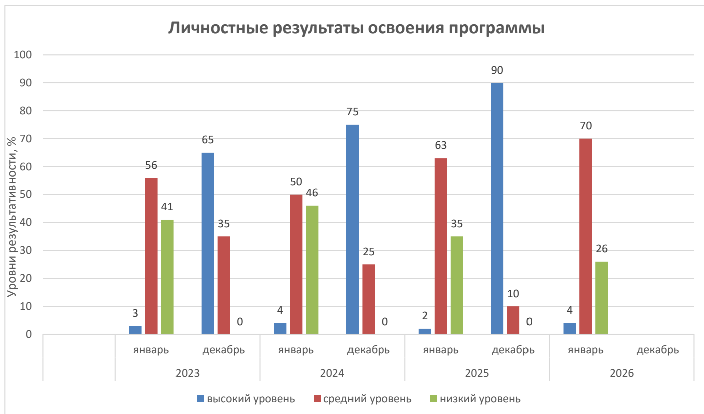
Рисунок 3. Оценка уровня сформированности личностных результатов по программе «Природа – наш дом» не менее 3-х лет

Результативность обучения является показателем эффективности освоения обучающимися представленной программы (таблица 4). Обучающиеся творческого объединения принимают активное участие в конкурсных мероприятиях естественнонаучной направленности: научных конференциях, конкурсах проектных и исследовательских работ различного уровня.